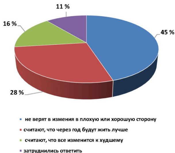
Рис. 2. Распределение ответов на вопрос «Как вы видите свое будущее?» ( n = 1600 , в процентах к опрошенным)

Кроме того, опрос позволил выяснить, каким наши сограждане видят свое будущее. Почти каждый второй (45 %) не верит, что что-либо изменится в плохую или хорошую сторону. 28 % говорят, что через год будут жить лучше. Наконец, 16 % считают, что все изменится к худшему (рис. 2).